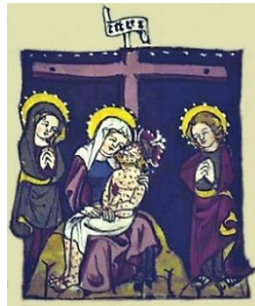
Anoniem – Pietà, 1320