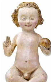
Mechelse pop, 1500