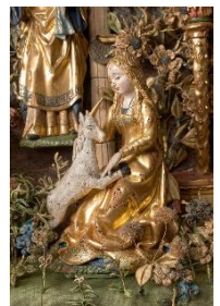
Besloten Hofje (detail)

Uiteindelijk ontstond ook de behoefte aan (een menselijke) Maria die treurt om haar zoon om zich mee te vereenzelvigen en zo dichterbij de lijdende Christus te komen. De Pietà was geboren!