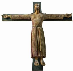
Anoniem - Volto Santo crucifix, 1200

In Mechelen zijn rond 1520 zelfs zgn. “Besloten Hofjes” 3 gemaakt, een soort diorama's met religieuze taferelen.