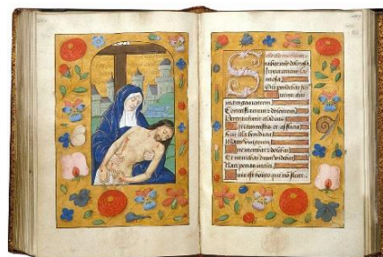
Anoniem – Getijdenboek, 1500