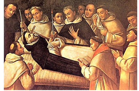
Sterfbed van Dominicus

Dominicanessen waren er nog niet maar de Spaanse priester Dominicus de Guzmán kreeg de pauselijke opdracht om de Katharen in Frankrijk te bekeren. Dat mislukte, maar hij kon enkele vrouwen losweken van de religieuze sekte en richtte een “safe house” in Straatsburg op voor deze vrouwen, zijn eerste klooster (1206).