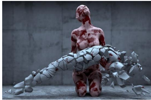
Martinakis – Pietà, 2013