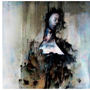
Hexxio - Morte della Pietà, 2019