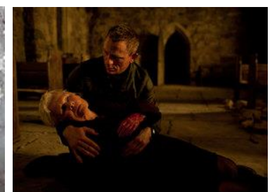
Mendes – James Bond-Skyfall, 2012