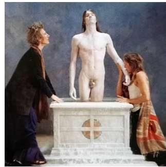
Viola - Emergence, 2002