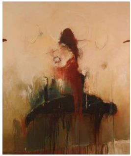
Ally – Pietà V, 2018