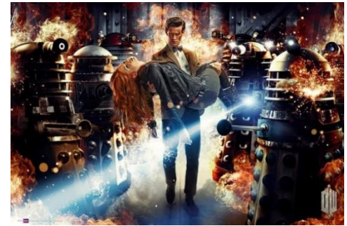
Binding - Doctor Who 7, 2013