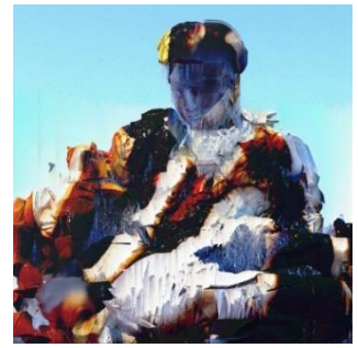
ADLP - Pietà, 2020