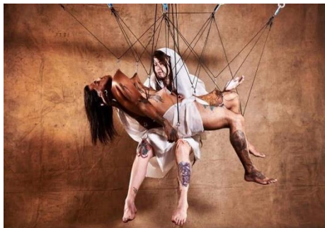
Cunha - Pietà Suspension, 2020