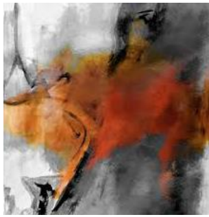
Amarante – Pietà, 2016