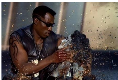
Toro - Blade II, 2002

In nogal wat films komt het Pietà-thema aan bod. Soms vanwege een overlijden, meestal als redding of troost.