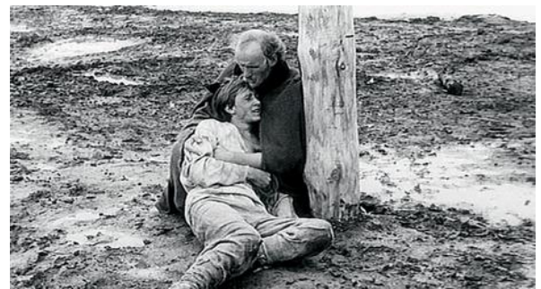
Tarkovski - Andrej Roelbljov (Filmstill), 1966

Onlangs keek ik de ruim 3 uur durende film 1 uit 1966 terug van Andrej Tarkovski over het leven van de grote Russische iconenschilder Andrej Roelbljov (1360-1430) die door de gruwelen van zijn tijd besluit niet meer te praten maar aan het eind van de film een jongen ontmoet die zojuist hoorde dat de door hem gegoten klok geslaagd is. Hij wordt overweldigd door zijn emoties en wordt door Roelbljov getroost (Pietà!) waarop die besluit met de jongen samen te gaan werken en zijn stilzwijgen op te heffen. Een hoopvol einde.