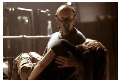
Scott – Hannibal, 2001