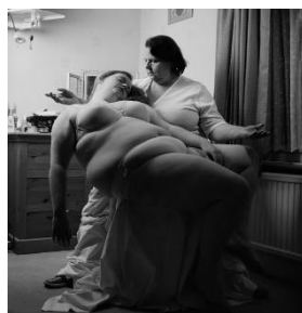
Bottomley - Pietà, 2013